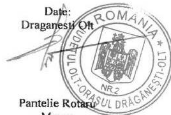
Pantelie Rotaru Mayor Dragasani

The ROMACT Programme is implemented in municipalities in several countries. The ROMACT process of around 20 months involves four steps: commitment, agreement on needs and plans, design of actions and projects, funding, implementation and monitoring. Additional information can be found on http://ec.europa.eu/romact