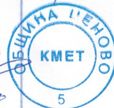
Петър Петров Кмет Ценово

The ROMACT Programme is implemented in municipalities in several countries. The ROMACT process of around 20 months involves four steps: commitment, agreement on needs and plans, design of actions and projects, funding, implementation and monitoring. Additional information can be found on http://romact.org/