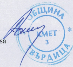
Atanas Atanasov Mayor Municipality of Tvarditsa